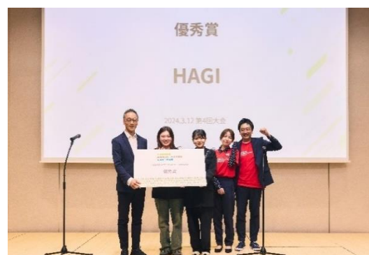
「RE FASHION MARKET」を提案した HAGI