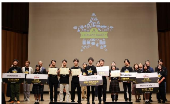
※ファイナリストの集合写真