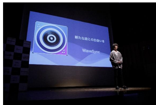
※プレゼンテーションの様子