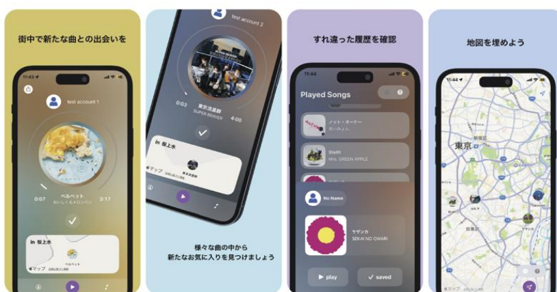
新しい音楽体験をテーマとした作品『Wave Sync』

街中ですれ違った人が聴いている曲を検知し、アプリ内でその曲を聴けるサービスです。同じような曲を聞き過ぎて飽きた時、街中や会話から新しい曲と出会えるように設計されました。ユーザーは、他人の聴いている音楽をラジオのように聴き、気に入った曲を Apple Music の自分のリストに追加できます。