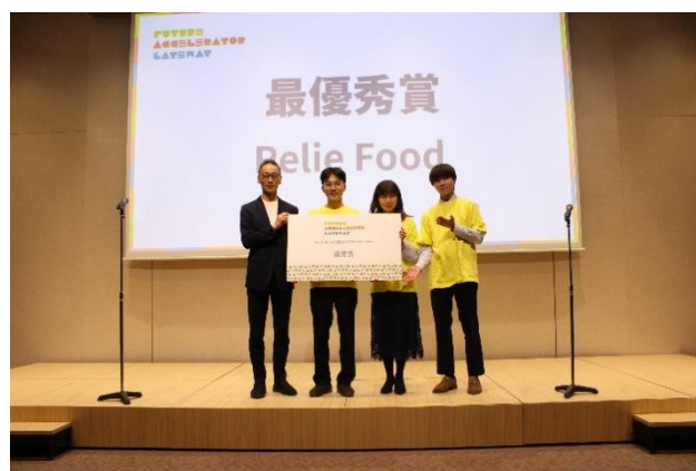
「ISSA KITCHEN TOKYO」を提供するRelie Food

※第3回の様子： https://www.to-mare.com/co-creation/2023/z3future-accelerator-gateway.html