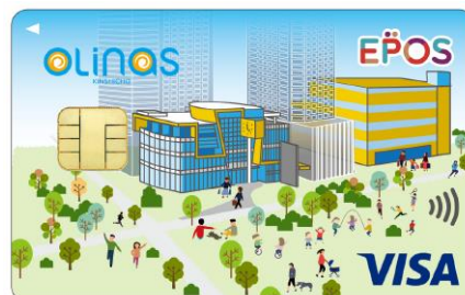
オリナス錦糸町エポスカード 「タウンデザイン」