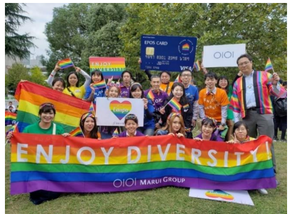
筑紫女学園大学LGBTQ同好会の学生さんと博多マルイ社員

2019年11月には九州レインボープライドにて筑紫女学園大学のLGBTQ同好会「C a a p a（チャーパ）」の学生の皆さまと共創し、一緒にブースを企画・運営しました。「すべての人が自分らしくいられる未来に向けて」というテーマでご来場の皆さまからメッセージを集めました。そして、集まったメッセージの数にもとづき、丸井グループから認定NPO法人ReBitさまの小中学生向けLGBTQ教材の支援活動へ寄付させていただき、学生の皆さまと一緒に多くの方の想いを次世代支援へとつなげる取り組みを行いました。