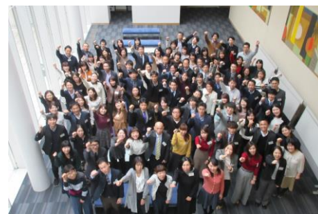
「ウェルネス経営推進プロジェクト」メンバー

2016年11月よりスタートしたグループ公認プロジェクト「ウェルネス経営推進プロジェクト」では、主体的に参加したメンバーが起点となり、全社員を巻き込みながらさまざまなウェルネス活動を企画・実行し、社内だけでなく社外に向けても取り組みを波及させています。