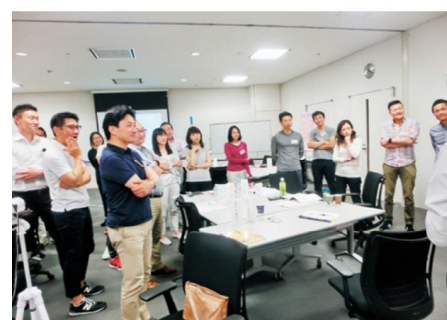
レジリエンス合宿には部長職から役員まで参加

トップ層が自身と周囲の活力を高める習慣を身につけることが、組織全体の活性化につながるという考えのもと、役員、管理職を対象に1期1年間の「レジリエンスプログラム」を実施。参加者が所属長を務める職場では、参加以降、職場の活力が向上しており、レジリエンスプログラムで習得した知識や習慣に基づく取り組みが周囲に好影響を与えています。