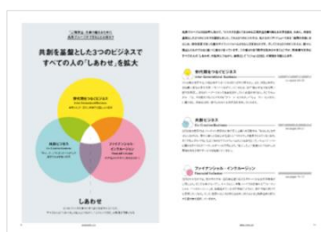
○共創を基盤とした3つのビジネス