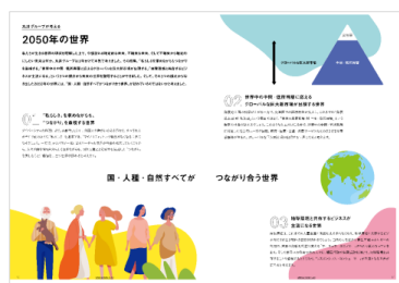
○丸井グループ ビジョン2050