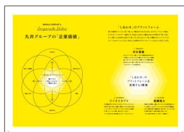
○丸井グループの企業価値

→ https://www.0101maruigroup.co.jp/pdf/settlement/18_1120/18_1120_1.pdf