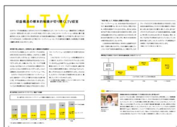
○LTV（生涯利益）を重視した長期視点での経営