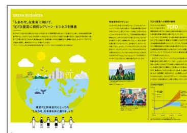
○TCFD提言に賛同しグリーン・ビジネスを推進