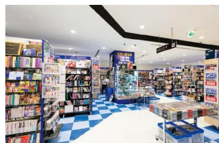
新宿マルイ アネックスの店舗