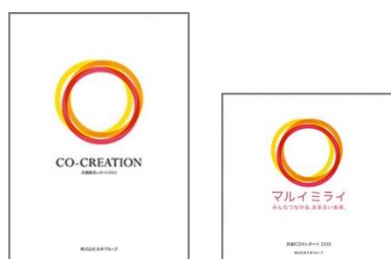
【2015年】 「共創経営」の宣言