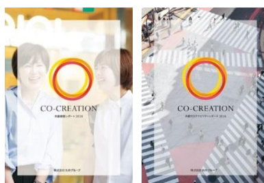
【2016年】 企業価値視点の「共創経営」