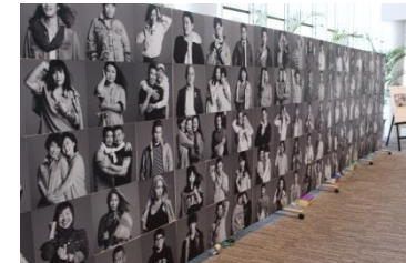
「OUT IN JAPAN」写真展