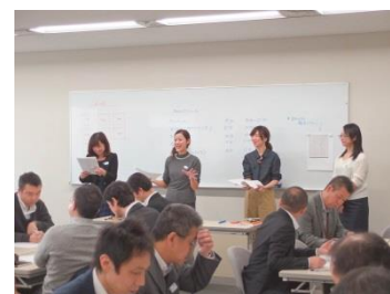
プロジェクトの様子