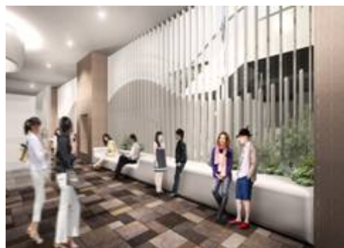
1階 エスカレーター横パブリックスペース（イメージ）

マルイグループは、「共創」をキーワードに、「店づくり」「モノづくり」をお客さまと一緒にすすめておりますが、この度の「博多マルイ」は、開店前のみならず、開店後もこうした取組みを継続し、お客さま、そして、お取引先さまも交えた「共創」の集大成として、末永くご愛顧いただけるような店づくりをすすめてまいります。さらには、日本郵便さま、近隣の皆さまとの共存共栄をはかり、微力ではございますが、福岡・博多の繁栄に貢献してまいりたいと考えております。