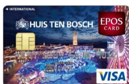
「ハウステンボスエポスカード」

これまで九州地区でも、「博多マルイ」開店前のファンづくりを目的に、九州の企業さま、商業施設さまとのカード事業での提携をすすめ、計6種類の「コラボレーションカード」をスタート。カード会員数は九州地区だけで10万人まで拡大しております。「博多マルイ」開店時までには、カード会員数13万人をめざし、一人でも多くのお客さまに、開業と同時に、エポスカードでの「おトクで便利」なショッピングをご提供できるように取組んでまいります。