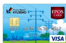
「九電工エポスカード」