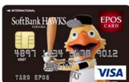
「クラブホークスエポスカード」