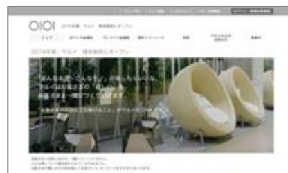
「コミュニティサイト」トップ画面

一方で、時間や場所の制約があり、会議への参加が難しいお客さまや、もう少し気軽に店づくりに参加したいというニーズに合わせ、Web上に「コミュニティサイト」を開設。従来よりも、幅広いお客さまが店づくりにご参加可能となり、「コミュニティサイト」を通じて、のべ約7000名（※）のお客さまにご参加いただきました。「博多マルイ」の名称も、この「コミュニティサイト」を通じて決定いたしました。