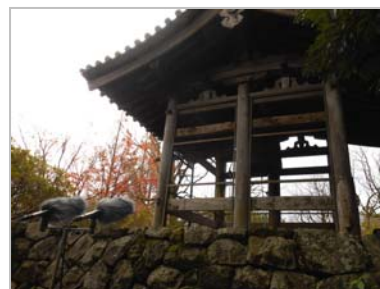
音源の集音作業の様子