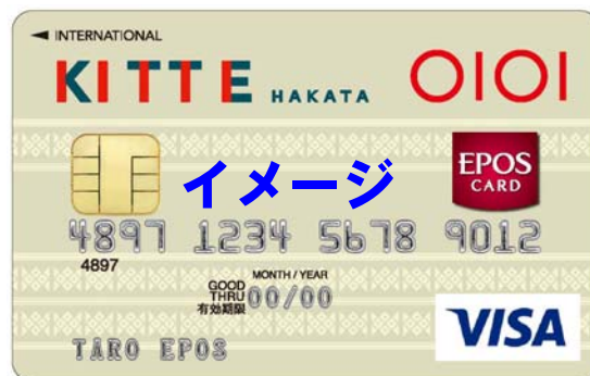
「博多織」をモチーフにしたカードデザイン (※サンプルにつき一部変更になる可能性があります)

カードの発行にあたり、博多マルイ店内に「エポスカードセンター」を設置。ICチップ付きのクレジットカード店頭即時発行を実施。お申し込み当日から、クレジットカードとしての機能、特典などがご利用可能となります。