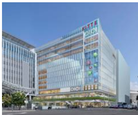
「博多マルイ」が出店させていただく「KITTE博多」完成予定図。

福岡市は、九州全域はもちろん、アジアからの外国人観光客の玄関口として、集客力も高い九州最大の都市です。また、博多駅前地区は、新幹線をはじめとするJRや市営地下鉄が乗り入れ、さらに、2020年には地下鉄七隈線延伸も計画されており、さらなる集客力の向上も見込まれます。