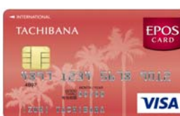
「橋エポスカード」(2016年2月発行予定)