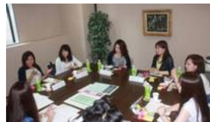
「お客さま企画会議」の様子

お客さま参加型の企画会議は、2014年7月以降、400回以上開催し、のべ約3000名（※）のお客さまにご参加いただいております。会議を通じて、お客さまと一緒に店づくりのポイント、フロア構成、品揃えなどを検討し、多数のご意見を頂戴いたしました。また、出店が決定したテナントの担当者さまにもご参加いただき、お客さま×お取引先さま×マルイの3者が一体となって、品揃えに関する議論をおこなっております。