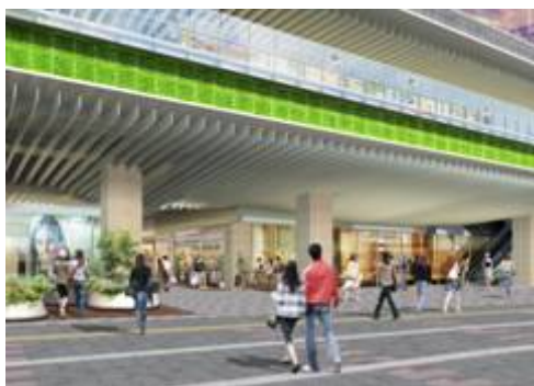
1階 駅側エントランス（イメージ）