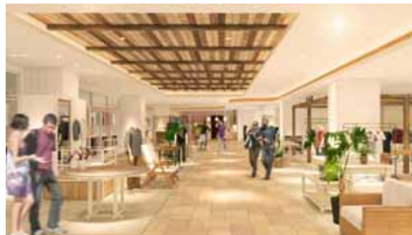
<夕方～夜のイメージ>