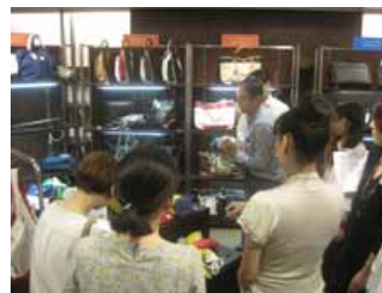
実際に売場でお客さまにお伺いしました。

丸井グループでは、これまで「お客さまの声に基づく店づくり」により、幅広いお客さまにご支持いただける店づくりをめざしてまいりました。新宿マルイのリニューアルにおいてもショップや品揃えなどについてご要望をお伺いしました。さらに新宿マルイ 本館では店舗環境についても深くお伺いし、また実際にお買い物体験をしていただき、「いいね」の具体的な要素をお伺いするなど、のべ約150名のお客さまと一緒に店づくりをすすめてまいりました。