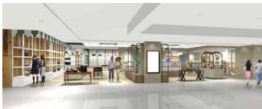
バッグとトラベルを男女で楽しめる「新雑貨ショップ」(8F)