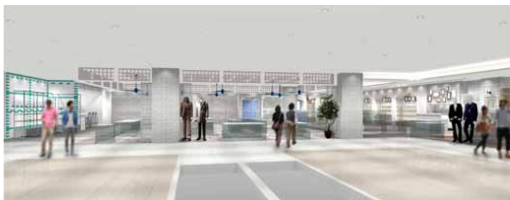
お客さまのご要望が多かった、頭からつま先まで揃う品揃え「新自主売場」(7F)

ファッションに関心があるすべての男女の方に、親しみを感じていただきたい。また、幅広い年代のお客さまに喜んでいただきたい。新宿マルイ 本館では、お客さまの声を活かした「新自主編集売場」や男女で楽しめる雑貨ショップなど、値ごろ感があり、気軽に立ち寄れるメニューが充実。雑貨やカフェなどの構成が約5割を占めます。各所にイベントスペースを設置し、その時々のお話、旬、流行をテーマにした期間限定ショップや体験イベントを展開します。お客さまの変わり行くニーズにお応えし、毎日新しい発見があるような楽しい売場づくりをめざし、常に新鮮なメニューでお客さまをお迎えます。