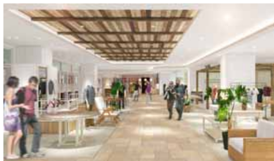
<朝～日中のイメージ>

( )ハイレゾ音源...CDの約3倍もの情報量を持った高音質音源。脳や自律神経に作用し、高いリラックス効果があるといわれています。