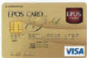
▲エポスゴールドカード

日本で初めての「クレジットカード」を発行したマルイグループ。これまでのノウハウを最大限に活かし、平成18年からは新たに「エポスカード」を発行、カードビジネスを推進しています。今後も利便性をさらに高めて、お客さまのライフスタイルをサポートしていきます。