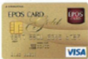
▲エポスゴールドカード

日本で初めての「クレジットカード」を発行したマルイグループ。これまでのノウハウを最大限に活かし、平成18年からは新たに「エポスカード」を発行、カードビジネスを推進しています。今後も利便性をさらに高めて、お客さまのライフスタイルをサポートしていきます。