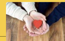
エポスカードの保険

エポスカード会員さまにちょうどいい保険選びをサポート。会員限定の医療・がん保険をはじめ、日常生活の不安解消につながる保険をご用意。さらにエポスカードで保険料をお支払いいただければポイントが貯まります。貯まったポイントは支払いにもご利用いただけます。