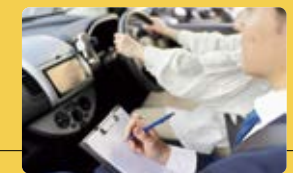
エポスの運転免許クレジット

支払いが発生する場面で、いつでもエポスカードを使ってもらえるようにシステムの中に埋め込む。このアセットを使ったエンベデッド・ファイナンスの好事例を今後も生み出すことをめざします。また同時に、当社が考える将来世代の未来や一人ひとりのしあわせをテーマに掲げるインパクトの実現につなげたいと考えています。