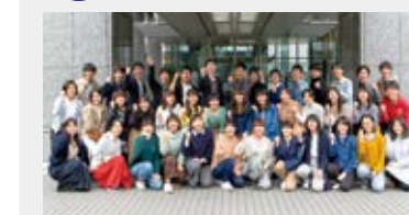
2019年度 新大学奨学生