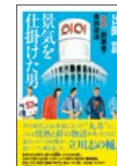
著者: 出町譲 / 幻冬舎