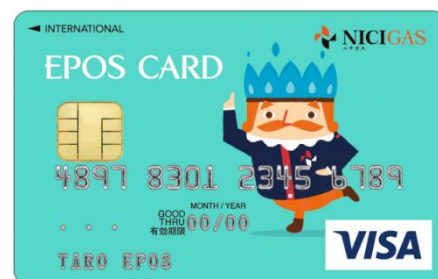
ニチガスのマスコットキャラクター

今回スタートする「 ニチガスエポスカード 」は、通常のエポスカード同様、入会金・年会費永年無料。また、新規入会特典として、月々のニチガスのガス料金を「ニチガスエポスカード」にてお支払いいただくと、初回カードのご請求金額から3,000円割引となります。加えて、すべての種類のエポスカード共通となる、全国10,000以上の店舗・施設での各種ご優待サービスもご利用いただけます。