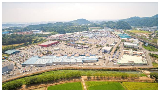
〒811-2502 福岡県糟谷郡久山町大字山田1111 トリアスHP→ http://www.torius.com

福岡県糟屋郡久山町に1999年オープンし、今年20周年を迎える商業施設。東京ドーム5個分の広大な敷地にファッション、飲食、スーパーマーケットのほか、日本1号店のコストコやアウトドアショップ、ホームセンター、ユナイテッド・シネマなどショッピングからエンターテイメントまで数多くのショップが揃います。屋外の開放感を満喫しながら家族揃って楽しめるオープンモールです。