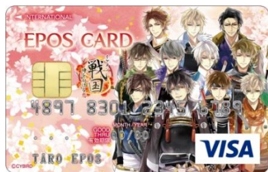
【イケメン戦国◆時をかける恋】