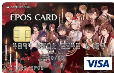
【イケメンヴァンパイア◆偉人たちと恋の誘惑】