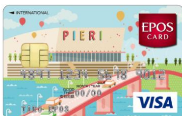
レイクサイドデザイン