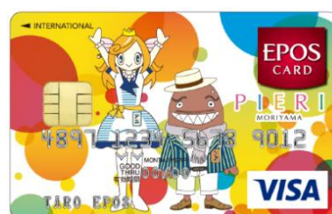
キャラクターデザイン

「ピエリ守山エポスカード」は、琵琶湖大橋と施設外観をイメージした「レイクサイドデザイン」、施設のイメージキャラクター「アユちゃん」と「ナズマ館長」を施設のイメージであるカラフルなドットの中にデザインした「キャラクターデザイン」の2種類の券面をご用意しました。