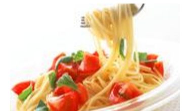
全国の飲食店で割引や優待

エポスカードは、全国10,000以上の飲食店、レジャー施設などと提携。さまざまな優待サービスを提供しています。一般的な提携カードは、入会した提携先の優待のみを受けるのに対し、エポスカードは1枚保有するだけで 当社のすべての提携先優待を受けることができます。