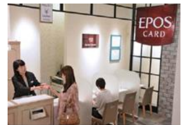
エポスカードセンター

提携先商業施設には、エポスカードセンターがテナントとして出店。マルイ・モディ店舗での 小売経験を持った(株)エポスカードのスタッフが常駐 し、お客さまへのご案内、申し込みから発行までの接客を行い、施設のファンづくりやカード会員の拡大に取り組めます。