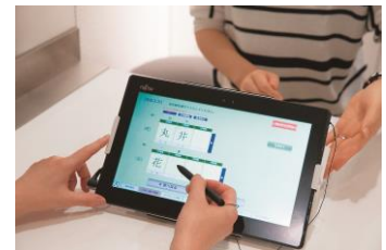
タブレット端末でのカード発行

エポスカードは、店頭タブレット端末での申し込みから、 世界最速の最短20分でカード発行できるCチップ搭載のVisaカード です。その場でカードをお渡しし、当日からご利用いただけます。