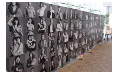
「OUT IN JAPAN」写真展