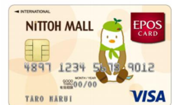
「ニットーモール エポスカード」

カードのお申し込みは「ニットーモール」2Fカードセンターおよび「ティアラ21」2Fサテライトカウンターにて承り、VISAブランドのICチップ付クレジットカードをお申し込み当日に発行いたします。また、「ニットーモール エポスカード」「tiara21 エポスカード」は、当該施設での入会・利用特典に加え、すべての種類のエポスカード共通となる、全国10,000以上の店舗・施設での優待サービスもご利用いただけます。