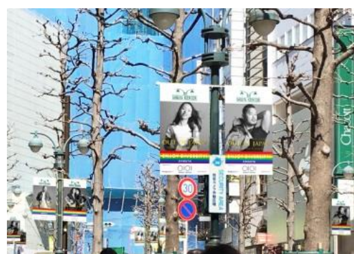
渋谷エリアでの大型写真展のイメージ