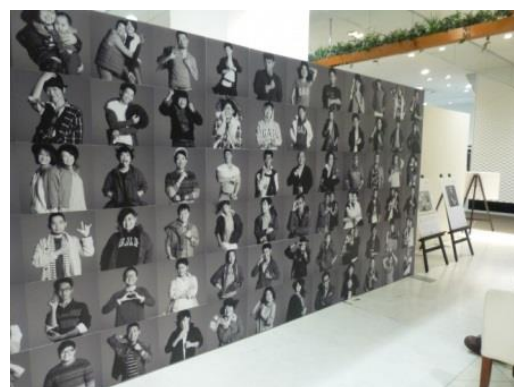
「OUT IN JAPAN」写真展の様子

また、「東京レインボープライド2018」フェスティバルの丸井グループブースにおいて「OUT IN JAPAN」撮影会を開催いたします。フォトグラファーには、世界的に有名なレスリー・キー氏が参加する予定となっています。