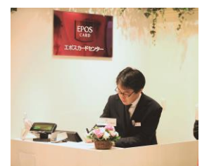
エポスカードセンター