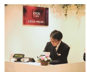
エポスカードセンター