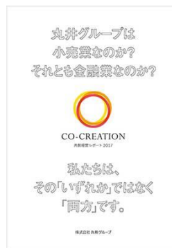
共創経営レポート

→ http://www.0101maruigroup.co.jp/sustainability/lib/s-report.html