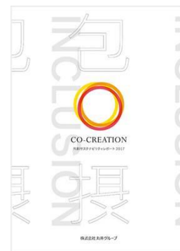
共創サステナビリティレポート