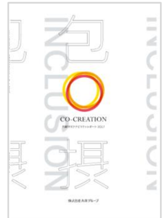
共創サステナビリティレポート (2017年12月)

→ http://www.0101maruigroup.co.jp/sustainability/lib/s-report.html