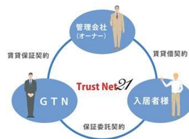
外国人専門保証サービス『Trust Net21』

家賃保証事業においては、賃貸住宅の情報提供から家賃保証、入居後の生活サポートにいたるまで、日本での生活を始める外国人の方を、全般的に支援するサービスを提供しています。