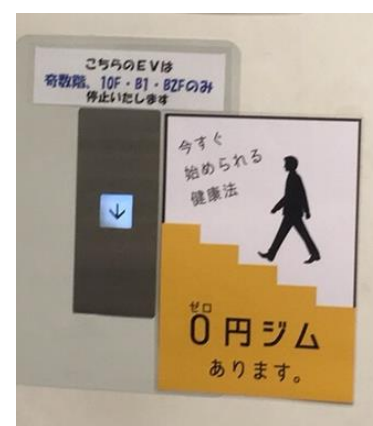
階段の利用を推奨するポスターを掲示

健康を切り口に意識や行動を変えることで、「病気にならない」というディフェンス（守り）の健康ではなく、一人ひとりが活力に満ち、よりイキイキと活躍できるためには、何をすべきか、というオフェンス（攻め）の健康に取組み、企業価値向上をめざすプロジェクトです。