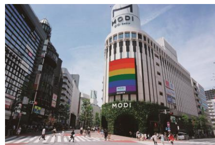
東京レインボープライド期間中の渋谷モディ

これからの日本の未来と丸井グループの役割を考えるプロジェクトです。世の中が抱える社会的課題について、当社グループがお役にたてること、求められることを考え、お客さまの多様性の受容（ダイバーシティ&インクルージョン）をすすめています。