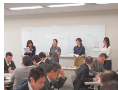
プロジェクトの様子