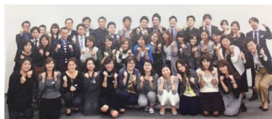
職場・年代を越えた多様なメンバー

「一人ひとりが互いの良さを認め合い、全員がイキイキと活躍できる風土づくり」の推進を目的に、当社グループが今後、さらに活力があり、生産性が高く革新しやすい組織となるにはどうすれば良いかを議論するプロジェクトです。