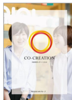
「共創経営レポート2016」

→ http://www.0101maruigroup.co.jp/csr/employee.html#divercity