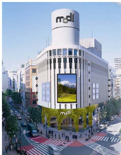
※ 現在作成中のイメージです

当社グループでは、「マルイ」「モディ」の2つのストアブランドで渋谷の街を盛り上げてまいります。どうぞご期待下さい。