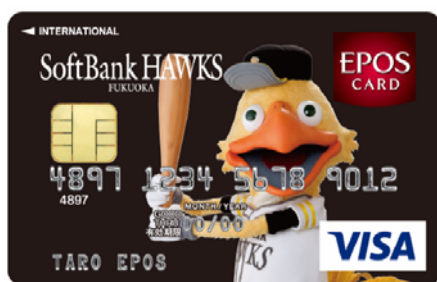
<ブラック / ハリー>

福岡ソフトバンクホークス株式会社（福岡県福岡市、代表取締役社長：後藤 芳光）と株式会社丸井グループのクレジットカード事業会社である株式会社エポスカード（東京都中野区、取締役社長：瀧元 俊和）は、2月1日（日）から、福岡ソフトバンクホークスの公式ファンクラブの提携クレジットカードとして新しく「クラブホークスエポスカード」の発行をスタートいたします。