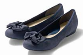
「新ラクチンきれい♡パンプス」

この「シューズLABO」を、今年11月より、「 掲示板 」や「 ブログ機能 」などをプラスして大きくリニューアル。全国のお客さまと一緒に靴について気軽に語り合い、また、商品開発をする「靴の総合コミュニティサイト」として独立したのが、