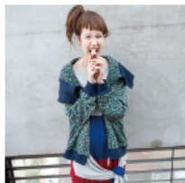
メルシーボーケー、