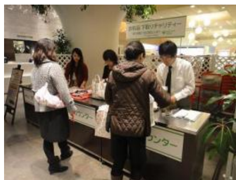
昨年11月に実施した時の様子(有楽町マルイ)

http://www.0101.co.jp/shitadori/index.html