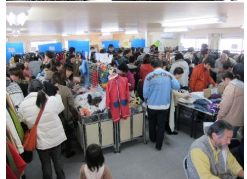
売場のような会場で社員が接客、楽しみながら洋服を選んでいただきます。