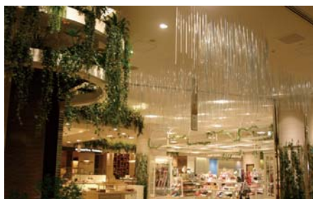
・新宿マルイ本館のエントランス環境

有楽町マルイや新宿マルイ本館では、それぞれお買物スペースとは別の「くつろぎ」「いやし」の空間であるエントランス、パウダールームなどに対してサラウンド・スピーカーシステムを導入しました。各スペースの目的に合わせて音が“香る”ようなサウンドデザインを追求。お客さまに心からくつろいでいただける音響空間を創出しました。