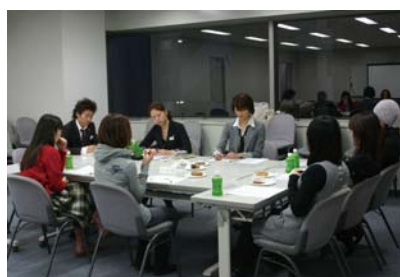
・お客さまにアンケートを細かく実施

フロアに流れるBGMは、音楽心理学に基づいたアンケートからわかってきた季節ごと・時間ごとに変化するお客さまの「ムード」と、フロアの内装やショップ構成がもつ店舗空間の「ムード」にあわせて東京藝術大学監修のもと楽曲をセレクト。