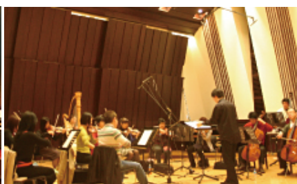
・さまざまな楽器編成で演奏し録音