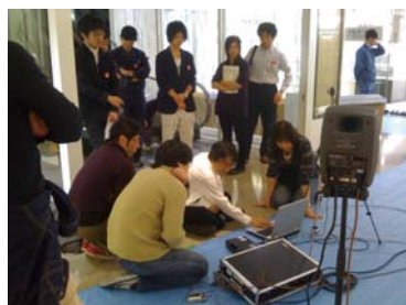
・流れる音量も時間帯ごとのムードにあわせて細かく調整