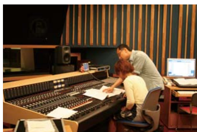
・教授の指導の下、学生が各々の感性で作曲

店内に配置されたいやしの環境空間に流れるオリジナルBGMを東京藝術大学が制作。有楽町マルイ、新宿マルイ本館のエントランスやパウダールームなど環境空間にあわせた曲から丸井全店の開店、閉店時の音楽など東京藝術大学音楽環境創造科がコンセプトにあわせて作曲しました。