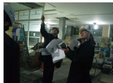
・店舗設計時から専門家のアドバイスを反映