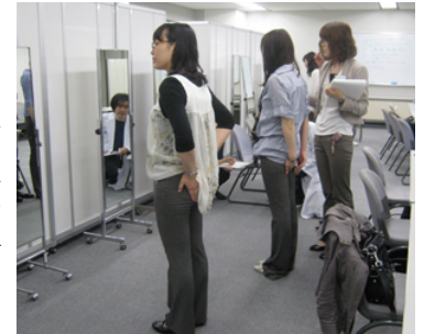
サンプルを試着していただき、ご意見をうかがう。

今、お客さまの価値観は劇的に変化しており、従来の「ファッション性」のような目に見える価値に加えて、「着心地」や「はき心地」などの内面的な価値を重視する傾向が強まっています。丸井グループでは、こうした変化に対応するために、 お客さまに直接ご参加いただき、一緒に商品開発 する取り組みをすすめています。今回は、「ラクチン快適バッグ」第2弾に加え、新たにレディスパンツ、メンズバッグがデビューいたします。