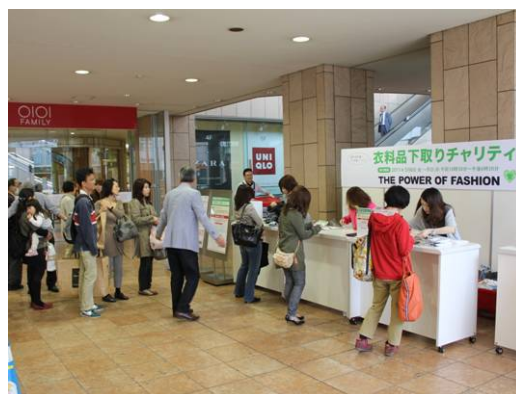
これまでに丸井数店舗で3回開催し、約1万6千人のお客さまより19万点を超える衣料品を受け付けました。