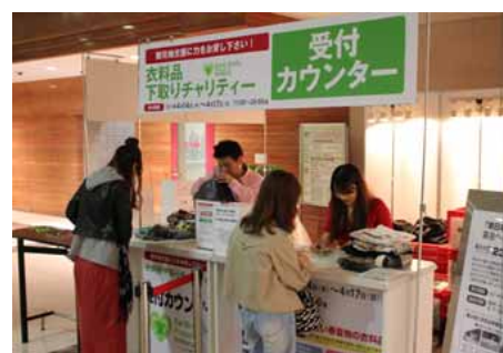
4月に実施した時の様子(マルイシティ横浜)

詳しくは5月5日発信のリリース『5月6日(金)～9日(月)「衣料品下取りチャリティー」を実施します!』をご覧ください。 http://www.0101maruigroup.co.jp/nr.html