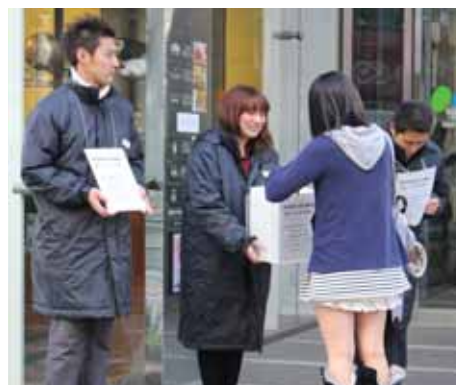
「募金活動」の様子(写真左:新宿マルイ本館 写真右:新宿マルイ アネックス)