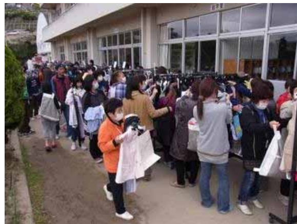
5月5日(木・祝)に気仙沼小学校で開催したイベントには約600名の方が参加。

丸井ではこれまで、被災地支援を目的とした「衣料品下取りチャリティー」を開催し、新品や新品に近い衣料品をお客さまから下取りしてまいりました。「東日本大震災」から約2カ月が経ち、被災者の意識は「衣食住の確保」から「生活再建」へと移行しつつあり、今後どのようにして日常生活へ回帰していくかが重要になってきています。そうした中で、お預かりした衣料品をただお配りするだけでなく、日常生活の中での楽しみの一つであるお買物のイベント形式にすることで、被災者の皆さんにファッション選びを楽しんでいただこうと考えております。