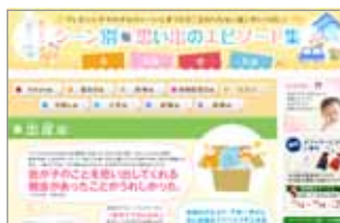
結婚編 出産編 入学編 就職編 などシーン別に掲載