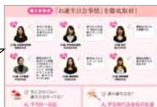
6名の「働く女性」が座談会形式で 「お誕生日会」を語ります!