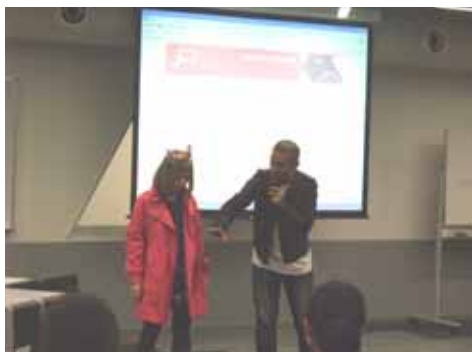
モード学園にて開催されたオリエンテーション(2010年5月)