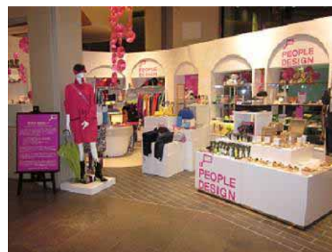
有楽町マルイにて開催された 「ピープル・デザイン コンセプトショップ」(2010年6月)

ネクスタイド関連商品を中心に、ピープル・デザインをテーマとした「アイデアセンス」、 「ノークワイエット」の商品を展示・販売いたします。 なんばマルイのみで開催