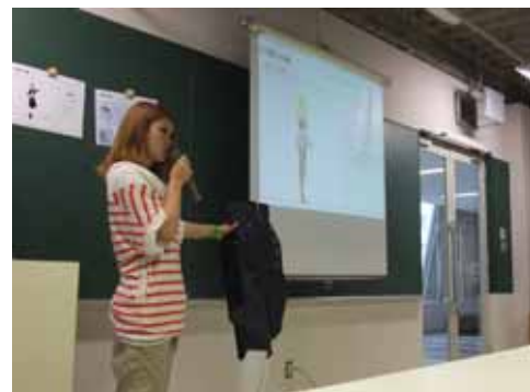
モード学園の学生によるプレゼンテーション(2010年9月)