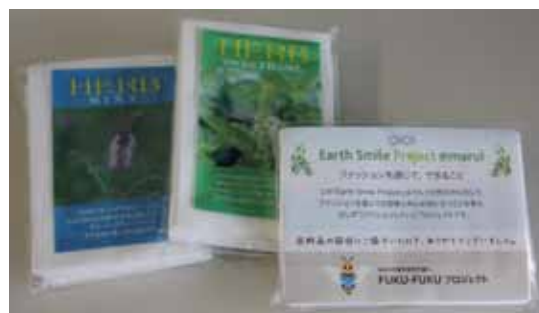
ハーブの種の袋が入ったポケットティッシュ