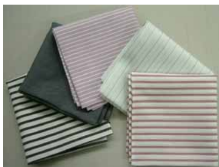
丸井のシャツ生産過程で発生した余り生地を使用したハンカチ