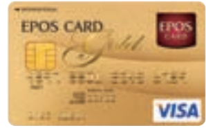
エポスゴールドカード

また、ゴールドカード・デザインカードを中心に、加盟店取扱高が高伸長しました。オンラインサービス「エポスネット」への登録促進や、公共料金決済の利用促進など、メインカード化に向けた施策の推進により、さらなる利用率の向上をはかります。