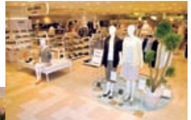
サイズ対応ショップ