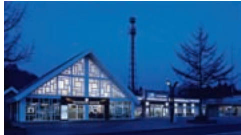
エムクリエイツ (空間プロデュース)

小売関連サービス事業各社では、小売事業、カード事業を中心に、マルイグループで培われたノウハウと専門性を活かした、企業向けのビジネスを強化しています。グループの経営資源を有効活用し、相乗効果を発揮することで、新たな事業の創出と既存事業の競争力強化をめざします。