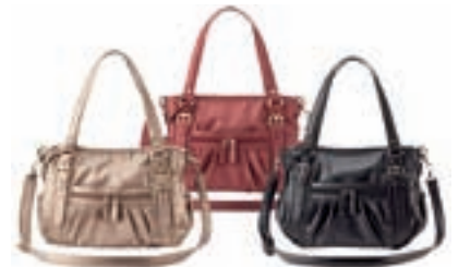
ラクチン快適バッグ

上半期の小売事業は、新規出店に加え、既存店舗の設備費や運営コストの見直しを継続して実施した結果、増収増益となりました。