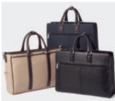
使い心地にこだわった「ラクチン快適バッグ」

昨年2月に発売した「ラクチンきれいパンプス」から始まったお客さま共同開発の取組みは、レディースバッグ、レディスパンツ、メンズバッグ、メンズシューズなど、さまざまなアイテムに拡大、幅広いお客さまからご好評いただいています。