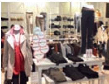
おしゃれとはき心地を両立 「ラクチン綺麗パンツ」