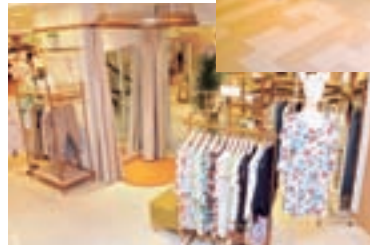
ブランドを組み合わせせて試着できるコーナー