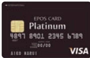
エポスプラチナカード

カード事業においても、お客さまニーズに対応した施策によるご利用客数の拡大と、三位一体化による収益力の向上に取組みました。エポスカードでは、「京都マルイ」で多くのお客さまにご入会いただいたことに加え、新しい入会特典「2,000円クーポン」の効果もあり、上半期のカード発行枚数は34万枚、前年同期比16%増と高伸長しました。また、ご利用額の多いゴールドカードやデザインカード会員が着実に増加するとともに、新たに「エポスプラチナカード」の発行を開始し、プレミアム会員に向けたサービスを充実。あわせて、オンラインサービス「エポスネット」の店舗での登録を促進してお客さまの利便性の向上をはかるとともに、ご利用明細のWeb化による郵送費の削減を継続するなど、ローコストな運営を推進しました。