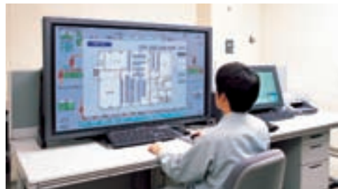
マルイファシリティーズ (総合ビルマネジメント)