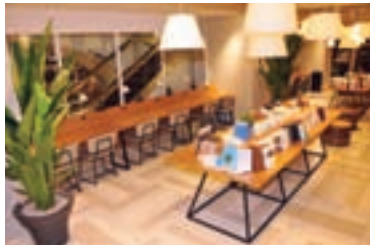
多数の本が用意されたパブリックスペース