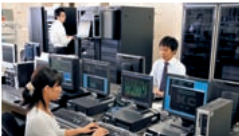
エムアンドシーシステム (情報システム)