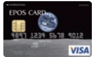
101種類から選べるデザインカード