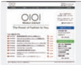
丸井グループホームページ www.0101maruigroup.co.jp

IR情報・グループ各社の紹介をはじめ、マルチ店舗のショッピング情報など、丸井グループの情報を詳しくご覧いただけます。