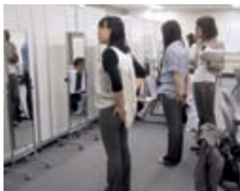
お客さまとの商品企画会議